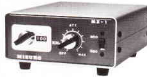
スカイマーカー MODEL MX-1