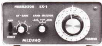
スカイマックス MODEL SX-1