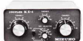
スカイカップラー MODEL KX-1